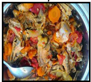
Domaća sardina sa povrćem